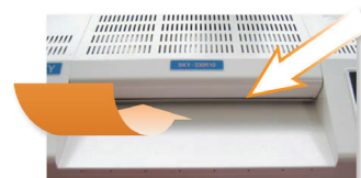
Special Protection Bar